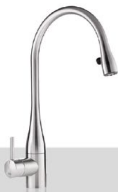
10.111.103.700 EVE Miscelatore inox monocomando con canna orientabile e doccino estraibile. 10.111.103.150 Nel colore bianco 10.111.103.700 EVE Mixing tap with integrated control, adjustable spout and pull-out spray. 10.111.103.150 In white colour