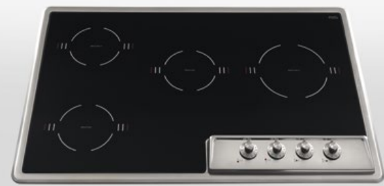
F 579/4EI Piano cottura da incasso a induzione con quattro zone cottura, largo cm 79 F 579/4EI Built-in induction hob with four cooking zones, 79 cm width

Area cottura organizzata con quattro fuochi diversi per cotture specifiche e differenziate.