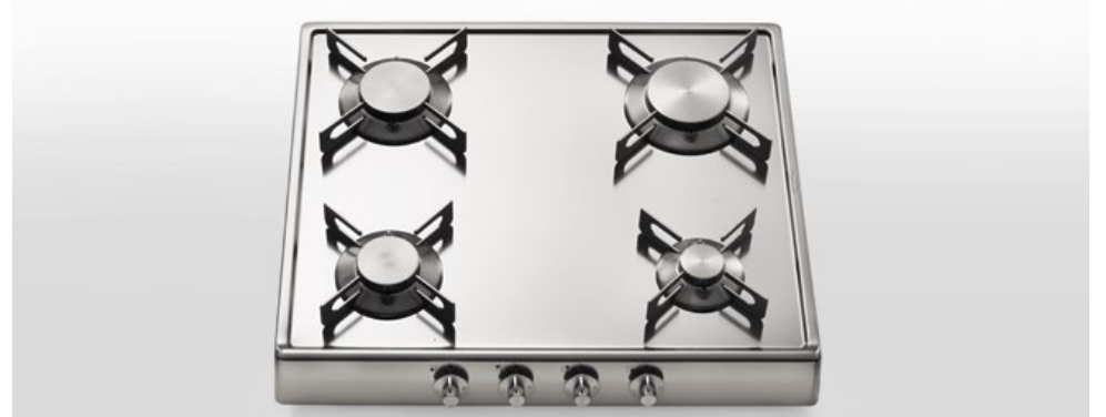
R 60/4G Piano cottura ribaltabile a quattro fuochi gas, largo cm 60 R 60/4G Flip-up hob with four gas burners, 60 cm wide

La posizione verticale libera lo spazio dedicato alla cottura. Un grande vantaggio per chi ha problemi di spazio. R 30/2GG e 2GR piani cottura ribaltabili a due fuochi gas, larghi cm 30 The vertical position frees up work space. A great advantage in situations of space shortage. R 30/2GG e 2GR Flip-up hobs with two gas burners, 30 cm wide