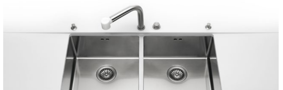
LSR 83/2V Lavello sottopiano raggio 12 a due vasche LSR 83/2V Undermount sink radius 12 with two bowls

Profondità Depth cm 40 Larghezza Width cm 83,5 Altezza Height cm 20