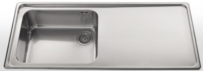
117/1V1SL Lavello da incasso ad una vasca ed uno scivolo liscio, largo cm 117 117/1V1SL Built-in sink with one bowl and one smooth draining-board, 117 cm width