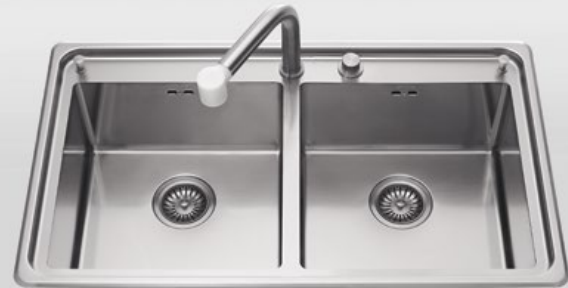
LFRS 587/2V Lavello a due vasche, largo cm 87 LFRS 587/2V Built-in sink with two bowls, 87 cm wide