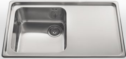
87/1V1SL Lavello da incasso ad una vasca e uno scivolo liscio, largo cm 87 87/1V1SL Built-in sink with one bowl and one flat draining-board, 87 cm wide

Modelli a una o due vasche, scivolo liscio destro o sinistro, bordo interno con salvagocce. Models may have one or two bowls with left or right flat draining-board, no-drip edge.