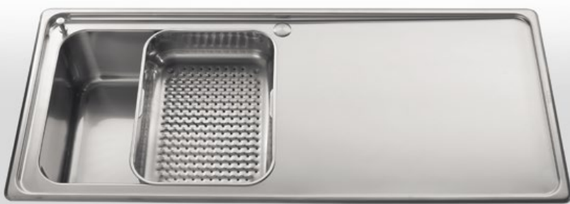
BF10 Bacinelle inox con fondo forato. Profondità cm 41 - Larghezza cm 31 - Altezza cm 10 BF10 Stainless steel basins with holey bottom. Depth 41 cm - Width 31 cm - Height 10 cm