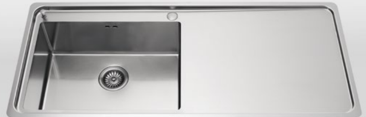
LFPS 5117/1V1SL Lavello a una vasca e uno scivolo liscio, largo cm 117 LFPS 5117/1V1SL Flush mount sink with one bowl and one smooth draining-board, 117 cm wide