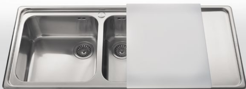
Taglieri in polietilene per i vari tipi di vasche e lavelli. Profondità cm 44 - 50. Larghezza cm 38 - 40 Polyethylene chopping-boards for different types of bowls and sinks. Depth 44 - 50 cm - Width 38 - 40 cm