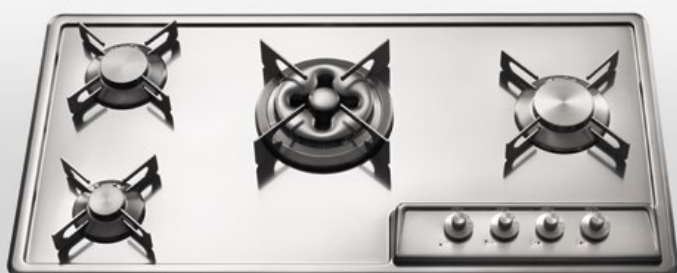
F 489/3GTC Piano cottura da incasso a quattro fuochi gas, largo cm 89 F 489/3GTC Built-in hob with four gas burners, 89 cm wide

Piano cottura incasso con cinque fuochi gas allineati e ben distanziati per ospitare pentole di grandi dimensioni. Posizionato al centro il bruciatore tripla corona Dual. Built-in hob with five gas burners in a line and set well apart for large pans. Dual triple crown burner at the centre.