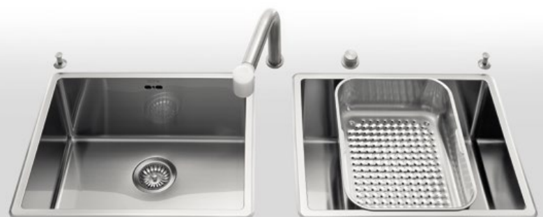
VFR 455 + VFR 455 Due vasche da incasso larghe cm 55 BF 10 Bacinella forata VFR 455 + VFR 455 Two built-in bowls, 55 cm wide BF 10 Basin with holey bottom