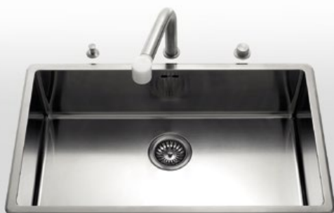
VFR 475 Vasca da incasso larga cm 75,5 VFR 475 Built-in bowl, 75,5 cm wide

Il pomello di apertura/chiusura del tappo va posizionato sul top della cucina. The control knobs for opening/closing the plug must be fitted on the kitchen countertop.