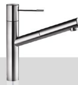
10.151.113.700 ONO Miscelatore monocomando con canna orientabile e doccino estraibile 10.151.113.700 ONO Mixing tap with integrated control, adjustable spout and pull-out spray