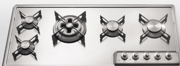
F 499/4GTC Piano cottura da incasso a cinque fuochi gas, largo cm 99 F 499/4GTC Built-in hob with five gas burners, 99 cm wide