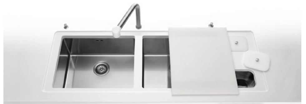
VSR 50 + VSR 50 Due vasche sottopiano larghe cm 50 PMR/158A Kit pattumiere alte per base con ante PMR/158C Kit pattumiere basse per base con cassetti VSR 50 + VSR 50 Two undermount bowls 50 cm wide PMR/158A Kit of tall waste bins for furniture with doors PMR/158C Kit of low waste bins for furniture with drawers