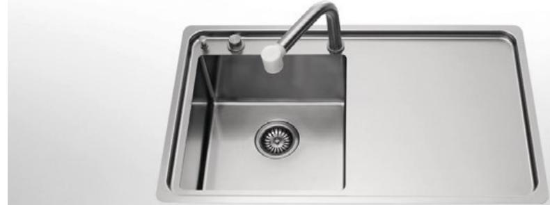
LFRS 587/1V1SL Lavello a una vasca e uno scivolo liscio, largo cm 87 LFRS 587/1V1SL Built-in sink with one bowl and one smooth draining-board, 87 cm wide