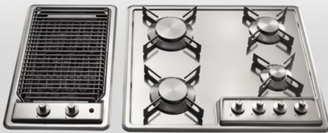
F 530/GE Grill elettrico da incasso, largo cm 30 F 559/4G Piano cottura da incasso a quattro fuochi gas, largo cm 59 F 530/GE Built-in electric grill, 30 cm width F 559/4G Built-in hobs with four gas burners, 59 cm wide