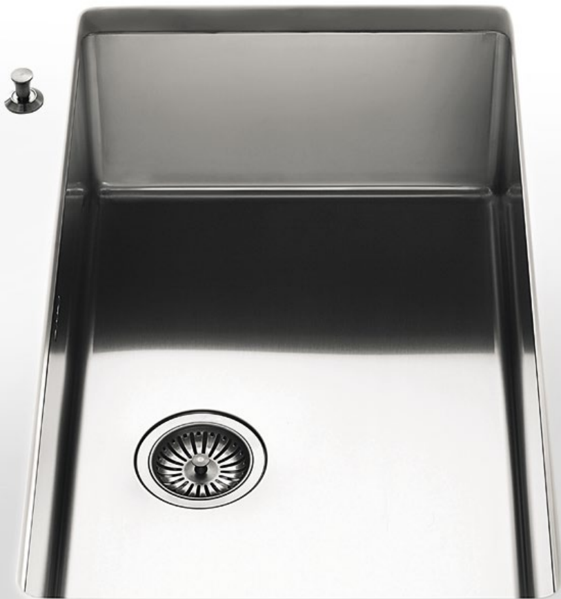
VSR 80 Vasca sottopiano larga cm 80 VSR 80 Undermount bowl 80 cm wide

Profondità Depth cm 40 Larghezza Width cm 34 - 40 - 50 - 70 - 80 Altezza Height cm 20