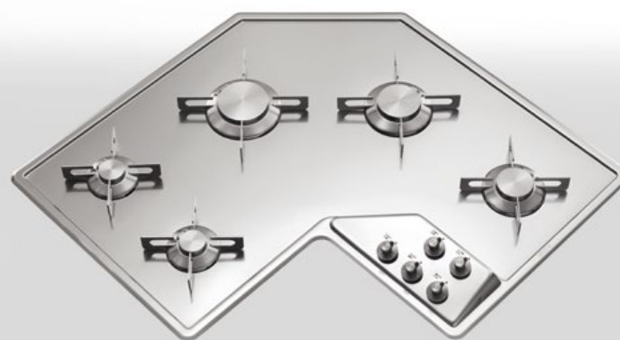
F 583/5G Piano cottura ad angolo a cinque fuochi gas da incasso, largo cm 83,5 x 83,5 F 583/5G Built-in corner hob with five gas burners, 83,5 x 83,5 cm width