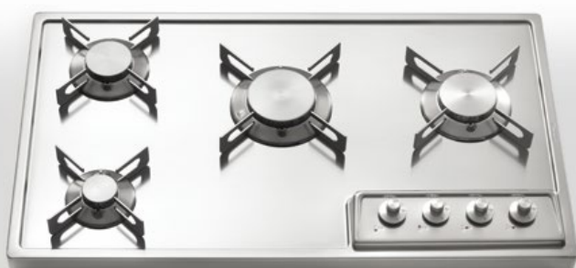
A 478/4G Piano cottura da appoggio a quattro fuochi gas, largo cm 78 A 478/4G Countertop hob with four gas burners, 78 cm width

Profondità Depth cm 45 Larghezza Width cm 78 - 88 - 98 Altezza Height cm 5