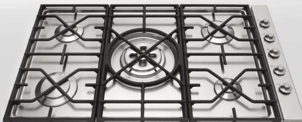
5698/4GTC-CL Piano cottura da incasso a cinque fuochi gas, tripla corona Dual, griglia in ghisa e comandi laterali, largo cm 98 5698/4GTC-CL Built-in hob with five gas burners, Dual triple crown burner, cast iron grid and side control knobs. Depth 98 cm