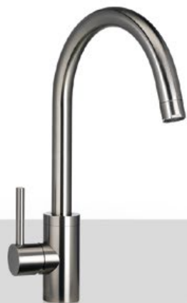
ALP 34 Miscelatore monocomando con canna orientabile ALP 44 Miscelatore monocomando con canna orientabile e doccino estraibile ALP 34 Mixing tap with integrated control and adjustable spout ALP 44 Mixing tap with integrated control, adjustable spout and pull-out spray