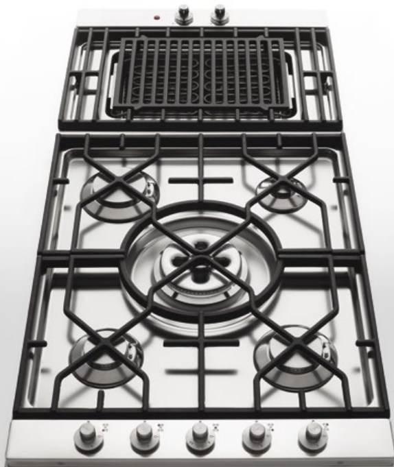
5641/GE-CL Grill elettrico con griglia in ghisa, largo cm. 41. 5674/4GTC-CL Piano cottura da incasso a cinque fuochi gas, tripla corona Dual, griglia in ghisa e comandi laterali, largo cm 74 5641/GE-CL Electric grill with cast iron grid, 41 cm wide. 5674/4GTC-CL Built-in hob with five gas burners, Dual triple crown burner, cast iron grid and side control knobs. Depth 74 cm

Piani cottura da incasso a gas e grill elettrico con griglie poggiapentola in ghisa. Built-in gas hob and electric grill with cast iron grid.