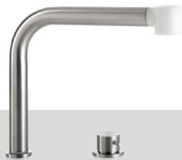
MCR 25 Canna orientabile totalmente estraibile con doccino in Derlin® bianco e CRL comando remoto MCR 25 Fully extractable spout of the tap with pull-out spray in white Derlin® and CRL remote control