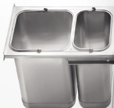
Profondità Depth cm 51 Larghezza Width cm 34 Altezza Height cm 53