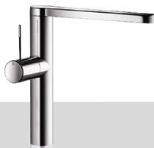
10.151.413.700 ONO Miscelatore monocomando con canna orientabile 10.151.413.700 ONO Mixing tap with integrated control and adjustable spout