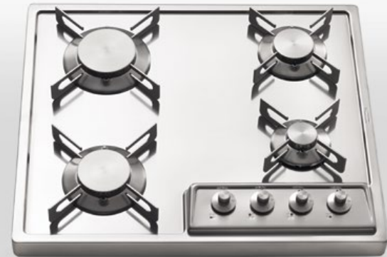
A 558/4G Piano cottura da appoggio a quattro fuochi gas, largo cm 58 A 558/4G Countertop hob with four gas burners, 58 cm wide