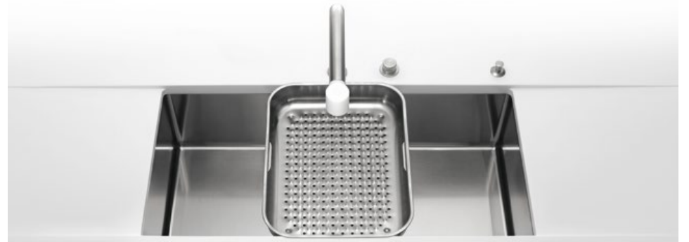
VSR 70 Vasca sottopiano larga cm 70. BF 10 Bacinella forata VSR 70 Undermount bowl 70 cm wide. BF 10 Basin with holey bottom