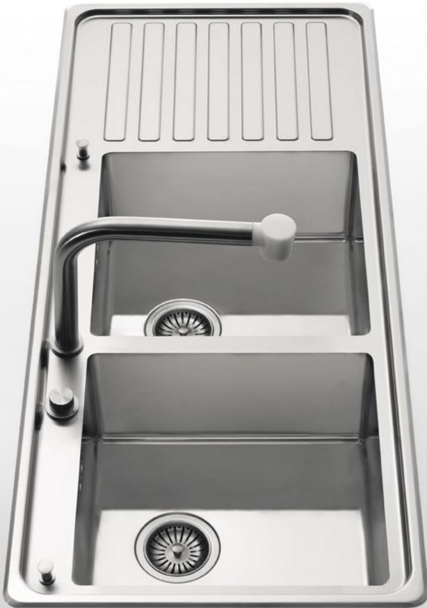
LFRS 5117/2V1S Lavello semifilo a due vasche con scivolo, largo cm 117 LFRS 5117/2V1S Built-in sink with two bowls and one draining-board, 117 cm wide

Modelli a una o due vasche, bacinella predisposta per tritarifiuti, scivolo inclinato liscio o disegnato (destra o sinistra), bordo interno con salvagocce, pomelli di apertura/chiusura tappo. The models may have one or two bowls, a small basin suitable for the waste disposal unit, a flat or ribbed draining-board to the right or left, a no-drip edge and the plug control knobs.