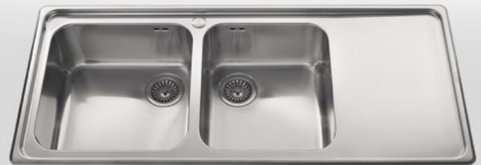
117/2V1SL Lavello da incasso a due vasche ed uno scivolo liscio, largo cm 117 117/2V1SL Built-in sink with two bowls and one flat draining-board, 117 cm width