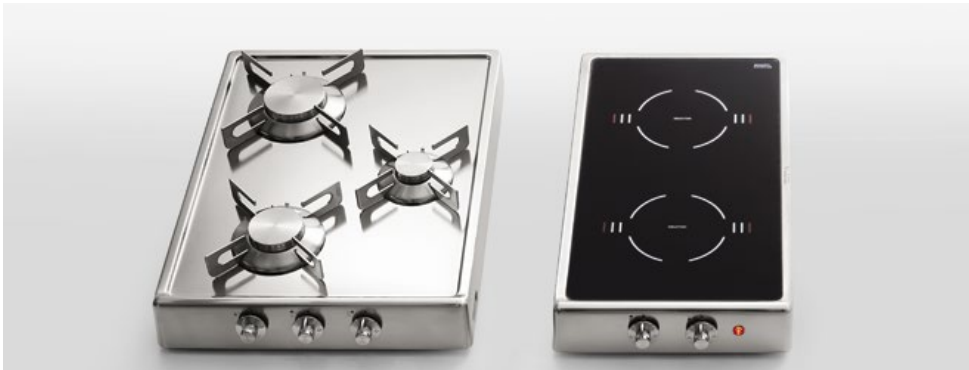
R 40/3G Piano cottura ribaltabile a tre fuochi gas, largo cm 40 R 30/2EI Piano cottura ribaltabile a induzione a due zone cottura, largo cm 30 R 40/3G Flip-up hob with three gas burners, 40 cm wide R 30/2EI Flip-up induction hob with two cooking zones, 30 cm wide