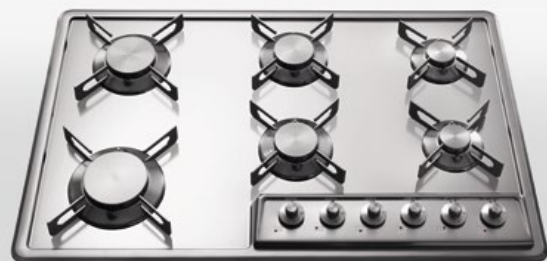
F 579/6G Piano cottura da incasso a sei fuochi gas, largo cm 79 F 579/6G Built-in hob with six gas burners, 79 cm wide