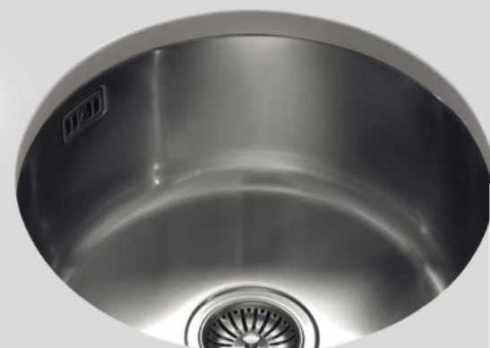
CO Ø 25 Colapasta S Ø 26 Scolapiatti T Ø 26 Tagliere CS Ø 24 Cestello CO Ø 25 Colander S Ø 26 Draining-board T Ø 26 Chopping-board CS Ø 24 Basket