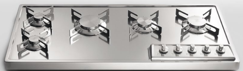
Tre importanti fuochi in linea e due fuochi piccoli abbinati per pesciere o singoli utilizzi. A 498/5G Piano cottura da appoggio a cinque fuochi gas, largo cm 98 Three large aligned burners and two small burners to use together under a fish poacher or individually. A 498/5G Countertop hob with five gas burners, 98 cm width