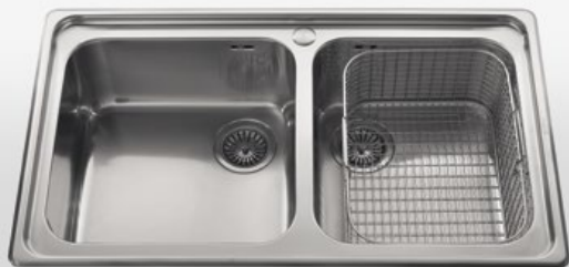
87/2V Lavello da incasso a due vasche, largo cm 87 87/2V Built-in sink with two bowls, 87 cm wide