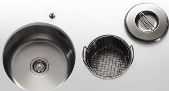
VS 40-D Vasca tonda da sottopiano Ø 40. VDS 25 Vaschetta da sottopiano Ø 25 predisposta per tritarifiuti. TE Ø 25 Tegame con coperchio. CS Ø 24 Cestello inox VS 40-D Undermount round bowl Ø 40. VDS 25 Small undermount bowl Ø 25 suitable for the garbage disposal. TE Ø 25 Pan with lid. CS Ø 24 Stainless steel wire basket

Ø 25 - 35 - 40 - Altezza cm 18 Ø 25 - 35 - 40 - Height 18 cm