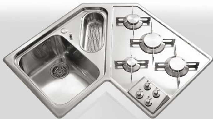
F 583/1V1B4G Piano lavaggio/cottura ad angolo a una vasca, una bacinella e quattro fuochi gas da incasso, largo cm 83,5 x 83,5 F 583/1V1B4G Built-in corner sink/hob unit with one bowl, one basin, and four gas burners, 83,5x 83,5 cm width