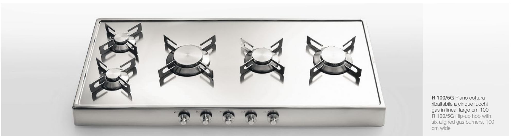
R 100/5G Piano cottura ribaltabile a cinque fuochi gas in linea, largo cm 100 R 100/5G Flip-up hob with six aligned gas burners, 100 cm wide

Profondità Depth cm 47 Larghezza Width cm 80 - 90 - 100 Altezza Height cm 7