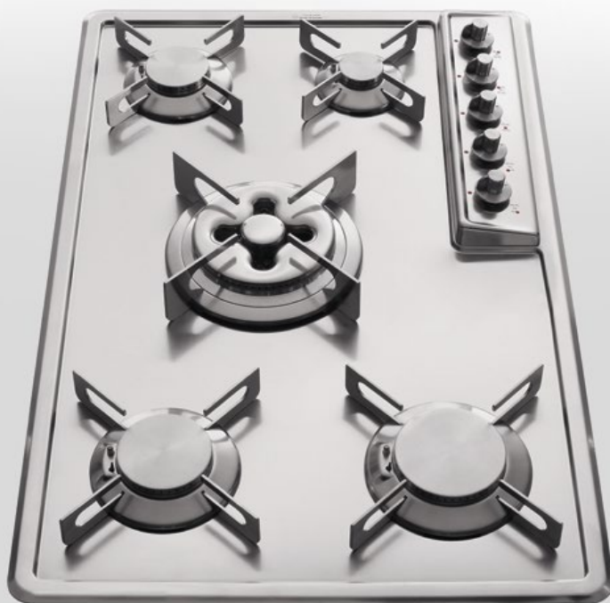
F 579/4GTC Piano cottura da incasso a cinque fuochi gas con bruciatore tripla corona Dual centrale, largo cm 79. F 530/2EI Piano a induzione con due zone cottura largo cm 30 F 579/4GTC Built-in hob with five gas burners, Dual triple crown burner at the centre, 79 cm wide F 530/2EI Electric induction hob with two cooking zones, 30 cm width