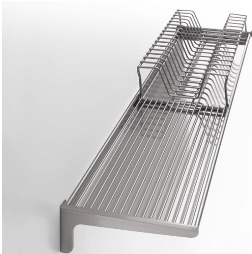
SP 99 Portapiatti largo cm 99 SP 99 Plate rack 99 cm wide

Una mensola inox da usare come portapiatti, porta bicchieri, porta oggetti. I portapiatti sono composti da staffe, vassoio raccogli gocce, griglia orizzontale e griglia verticale, sono costruiti in acciaio inox aisi 304 con satinatura argento. A stainless steel rack for plates, glasses and other objects. The racks, consisting of brackets, drip trays, a horizontal support and a vertical support, are made of Aisi 304 stainless steel with silver satin finish.