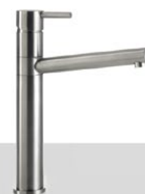
ALP 33 Miscelatore monocomando con canna orientabile ALP 33 Mixing tap with integrated control and adjustable spout