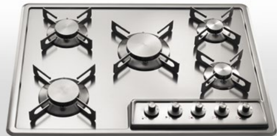
F 569/5G Piano cottura da incasso a cinque fuochi gas, largo cm 69 F 569/5G Built-in hob with five gas burners, 69 cm wide