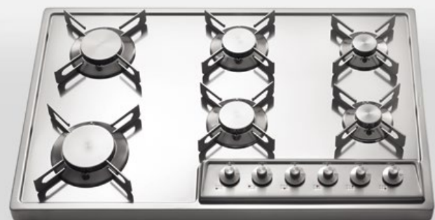
A 578/6G Piano cottura da appoggio a sei fuochi gas, largo cm 78 A 578/6G Countertop hob with six gas burners, 78 cm wide