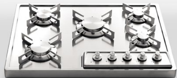
A 568/5G Piano cottura da appoggio a cinque fuochi gas, largo cm 68 A 568/5G Countertop hob with five gas burners, 68 cm wide