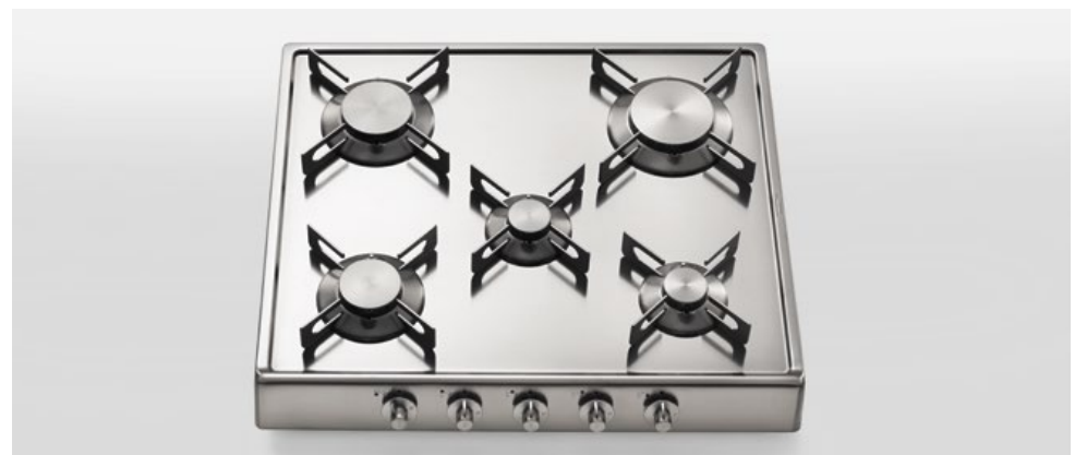
R 60/5G Piano cottura ribaltabile a cinque fuochi gas, largo cm 60 R 60/5G Flip-up hob with five gas burners, 60 cm wide